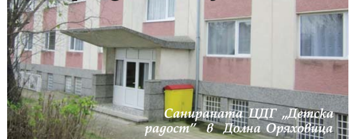
Санираната ЦДГ „Детска радост“ в Долна Оряховица

4 детски градини през последната година спечелиха проекти пред МОН по Националната програма „Модернизация на материалната база в училище“ за подобряване на учи-