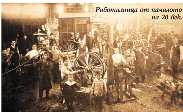
Работилница от началото на 20 век.