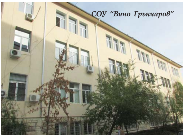
СОУ „Вичо Грънчаров“

тично е подменена и дограмата в много детски градини: ЦДГ „Богра смяна“, ЦДГ „Първи юни“ и СДГ „Детски свят“ в Горна Оряховица, ЦДГ „Детска радост“ в Долна Оряховица, ЦДГ „Асен Развиевников“ в Драганово, ЦДГ „Димитър Генков“ в Поликраище, ЦДГ „Здравец“ в Първомайци, ЦДГ „Слънчице“ във Върбица, филиал с. Писарево.