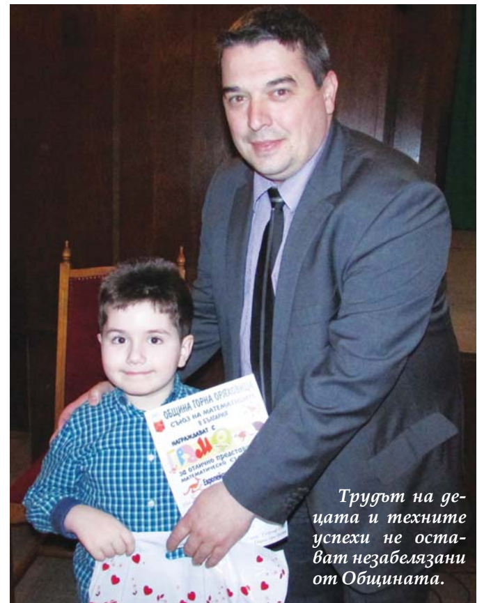
Трудът на децата и техните успехи не остават незабелязани от Общината.

безопасността на детските площадки. Положителен факт е, че площадки изградени в междублоковите пространства се пазят, гражданите ги поддържат и се грижат за тях.