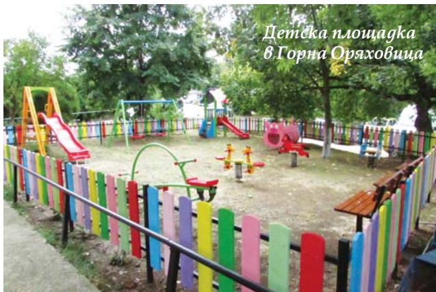
Детска площадка в Горна Оряховица

Реализиран бе благотворителен проект на стойност 33 000 лв., спонсориран от фондация „Приятелите“ - Велико Търново на британката Кристин Фокс за креативна детска площадка във вътрешния двор на ЦДГ „Ален мак“ в Горна Оряховица. Детското съоръжение бе изградено безвъзмездно от английски студент