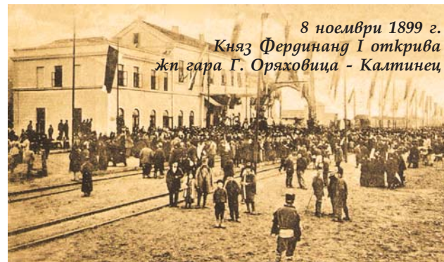
8 ноември 1899 г. Княз Фердинанд I открива жп гара Г. Оряховица - Калтинец

ки българска гържавба започва да планира осъществяването на своите съкровени стремежи – постигане на пълна независимост от Османската империя и национално обединение на изконните бъл-