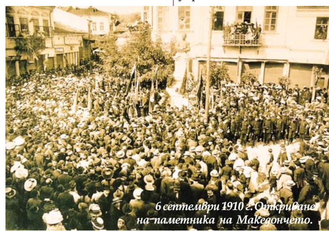
6 септември 1910 г. Откриване на паметника на Македончето.