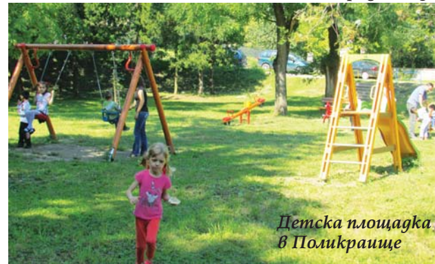
Детска площадка в Поликраище

За 2015 г. в капиталовите разходи на Общи-