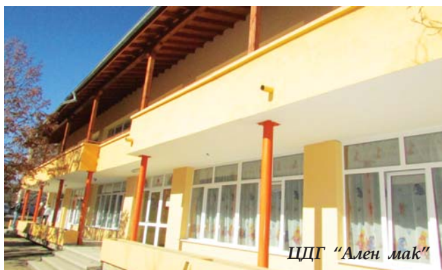
ЦДГ „Ален мак“

тажните работи е 100 000 лв. С близо 1 млн. лв. бе направена енергийно ефективна реконструкция на СОУ „Вичо Грънчаров“ и ЦДГ „Ален мак“. Средствата бяха осигурени от Международен фонд „Козлодуй“ за подобряване на материалната база. В съставните селища на общината, където на-