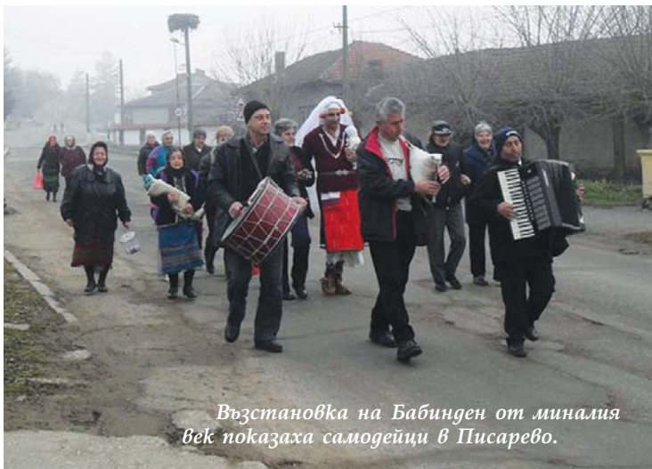
Възстановка на Бабинген от миналия век показаха самодейци в Писарево.